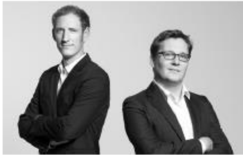
Design by Bernard / Burkhard

Najlepša hvala vsem, ki so sodelovali v tem projektu: Charly Liu s svojim angažiranjem in organizacijo, Bob Hong s koordinacijo, Alan Ai in Johnson Xia John Ye z inženiringom in CAD delom, Mario Rothenbühler s fotografijami, Fabian Bernhard in Thomas Burkard s čudovitim dizajnom in Matti Walker z grafičnim oblikovanjem.