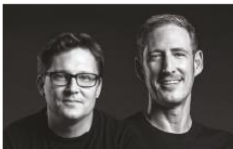
Design by Bernhard / Burkard